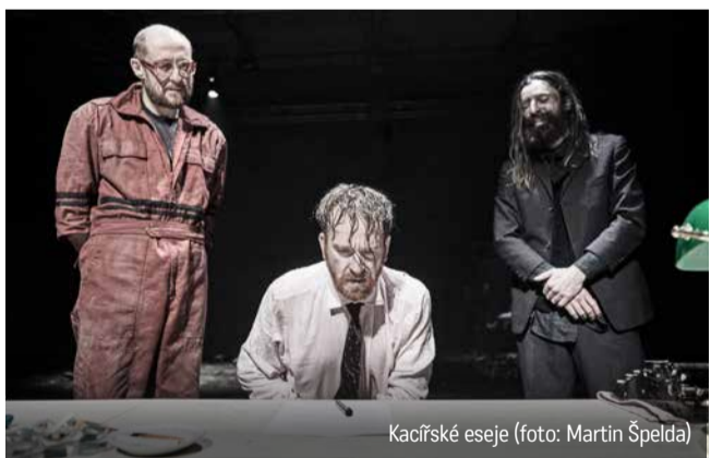
Kacířské eseje