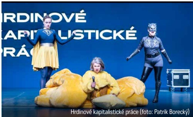
Hrdinové kapitalistické práce