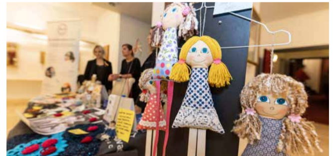
Děkujeme všem návštěvníkům premiérového představení Pan Scrooge, kteří se zastavili u stánku neziskové organizace Šance Olomouc a zakoupili si některý z výrobků od umělců Moravského divadla. Celkem se podařilo vybrat téměř 4000 korun.